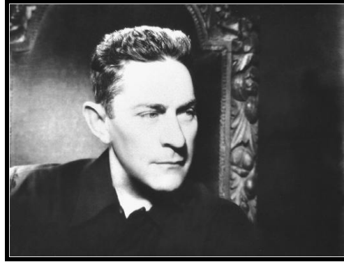
Fernando de Fuentes

Nombre completo: Fernando de Fuentes Carrau Lugar de nacimiento: Veracruz, Veracruz, México Fecha de nacimiento: 13 de diciembre de 1894 Fecha de fallecimiento: 4 de julio de 1958