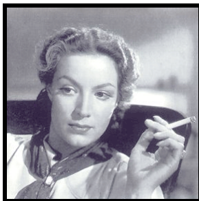
Doña Bárbara (María Félix)

Consta de tres partes: la primera contiene 13 capítulos y la segunda escrita con el motivo de la aparición de “Doña Bárbara”.